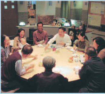
みんな楽しく中国語会話

この講座は、先生も生徒もい ません。皆と一緒に中国語で楽 しく話し合うのが特徴です。こ の講座の目的は、中国語が読め るだけではなく聞いて分かる 話せることも上手になるよう にさせたいです。今は、色々な事 を話題にして面白く楽しく会話 しています。これからは、皆さ んと相談しながら、テーマを決 めていこうかと思っています。