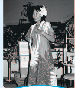
フレンドシップサロン