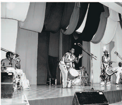
布を重ねて表現した「混沌」と「世界の融合」

イムカードを作ってくれ！」と冗談を言ったほどです。またこのような機会があったら、ぜひ参加したいです。お客さん、スタッフ、どのような形で参加してくださった方々、全員の方で一つの成功という形にできたこと、ありがとうございます。