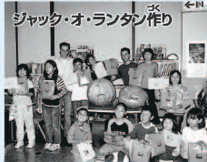
ジャック・オ・ランタン作り