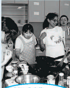
世界の料理クラブ