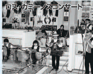
ロス・カミーヌコンサート