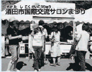
酒田市国際交流サロンまつり

こんなことがありました。もうすっかり秋ですね。読書の秋、芸術の秋、食欲の秋…。あなたはどんな秋にしますか？