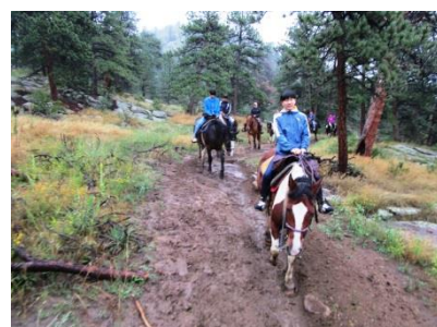
コロラドの大自然を満喫!