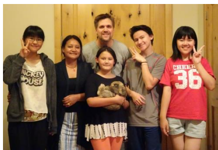
ホームステイを通して アメリカの生活を体験

「英語は苦手だけど、アメリカの文化に触れてみたい」、「本場で英語の授業を受けたり、ホームステイをしてみたい」、「アメリカの広大な自然を見てみたい」と思っている方、このツアーに参加して、夢を実現させませんか？