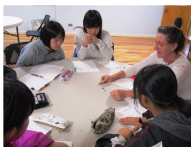
実践的な英語の授業