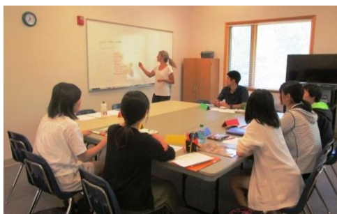
実践的な英語の授業