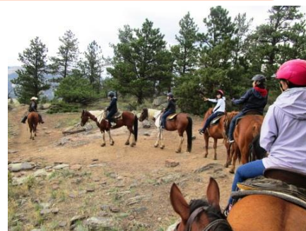
コロラドの大自然を満喫!