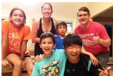
ホームステイを通して アメリカの生活を体験

この事業は山形県と姉妹州であるコロラド州の人たちとの交流を通し、国際的感覚を体験的に身につけ、英語実践力を向上させることなどを目的に実施しています。「 英語はちょっと苦手だけど、短期間でもアメリカの実生活を体験したい 」、「 本場で英語の授業を受けたい、ホームステイをしてみたい 」、「 アメリカの広大な自然を体で感じてみたい、体験してみたい 」と思っている方、このツアーに参加して、夢を実現させませんか? 中学生以上、社会人まで参加できます。